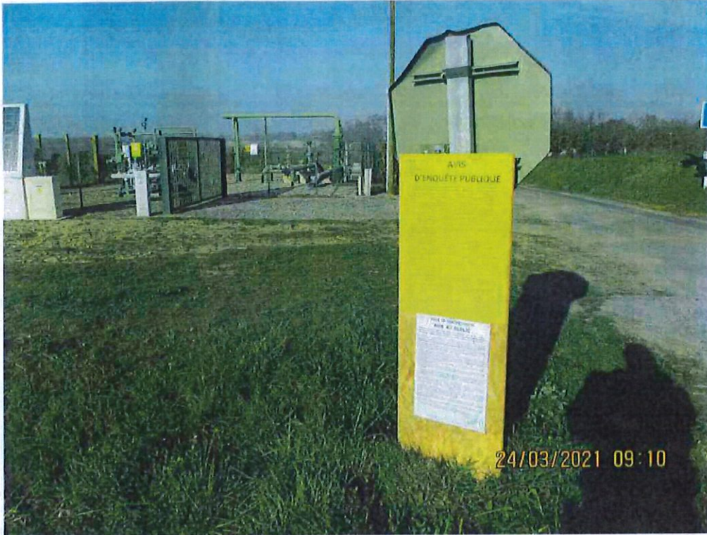
6 – RD92 – Intersection RD234